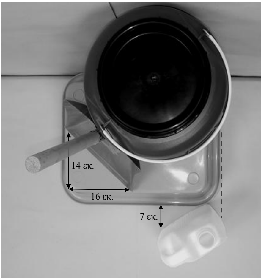
Δεύτερη φωτογραφία: Κάτοψη